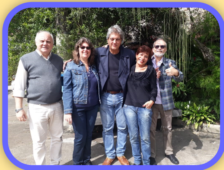
Foto com representantes da SEAERJ

A eleição do Conselho ocorrerá do dia 30/08 até 05/09 , e será realizada pela internet, através do acesso a página do Carioca Digital.